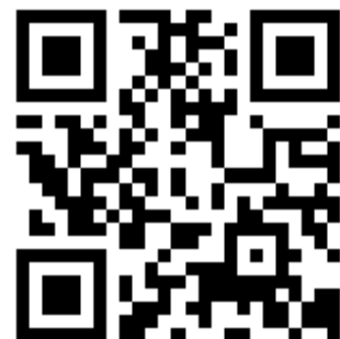
QR koda 2: http://zgo-nem.weebly.com/