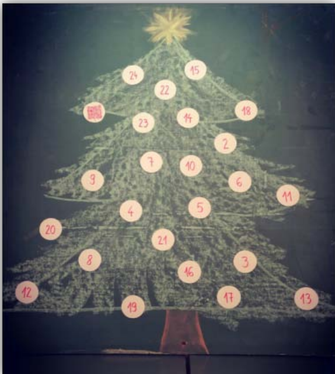
QR koda 1: Utrinki projekta "Spoznajmo sosede"